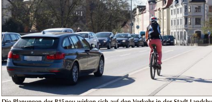
Die Planungen der B15neu wirken sich auf den Verkehr in der Stadt Landshut aus.

Dieser Ringschluss hätte neben der Variante 1a im Osten und Süden der Stadt eine Weiterführung der geplanten Westtangente über die B11 hinaus in den Landkreis umfasst. An der B15 alt wären dann beide Straßen zusammengetroffen. Da die Weiterführung einer Westtangente politisch hoch umstritten ist, ließen die Reaktionen auf die aktuellen Entwicklungen nicht lange auf sich warten: „Mit dem Aus für diese Variante zerplatzt aber auch der Traum des Landshuter OB von einem Ringschluss um Landshut“, stellt beispielsweise die Grünen-Landtagsabgeordnete Rosi Steinberger in eine gestern versandten Pressemitteilung fest. Die Politikerin sprach sich wiederholt gegen eine Weiterführung der Westtangente über die B11 hinaus aus. Aus ihrer Sicht verfehlten die beiden verbliebenen B15neu-Trassen (1b und 1c) das Ziel, die Stadt Landshut wirksam vom Verkehr zu entlasten.