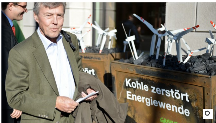
Den Umweltorganisationen stand Göppel allerdings oft näher als seinen Parteifreunden.

Der Bayernkurier hat mich meist ignoriert. So wie es überhaupt die Strategie der Unionsführung war, mich als Einzelstimme darzustellen. Im Bundestag bin ich nur bei einer ersten wichtigen Gegenstimme gegen ein Unionsprojekt angerufen worden. Damals ging es um die Griechenland-Hilfe, die ich mit der Finanztransaktionssteuer verbinden wollte. Da haben am selben Nachmittag Merkel, Hasselfeldt, Schäuble und Seehofer angerufen.