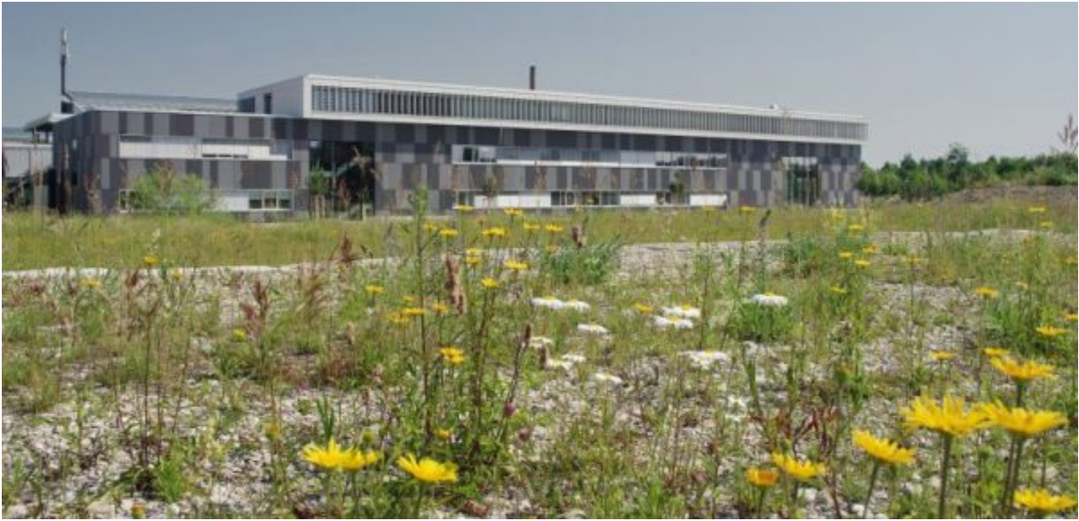
Garten beim Bayr. Landesamt für Umwelt

Umweltverstößen selbst klagen, oder mittels Verbandsklage können wir bestimmte Verwaltungsentscheidungen gerichtlich überprüfen lassen, ob sie rechtmäßig ergangen sind - bisher durften wir das alles nicht.